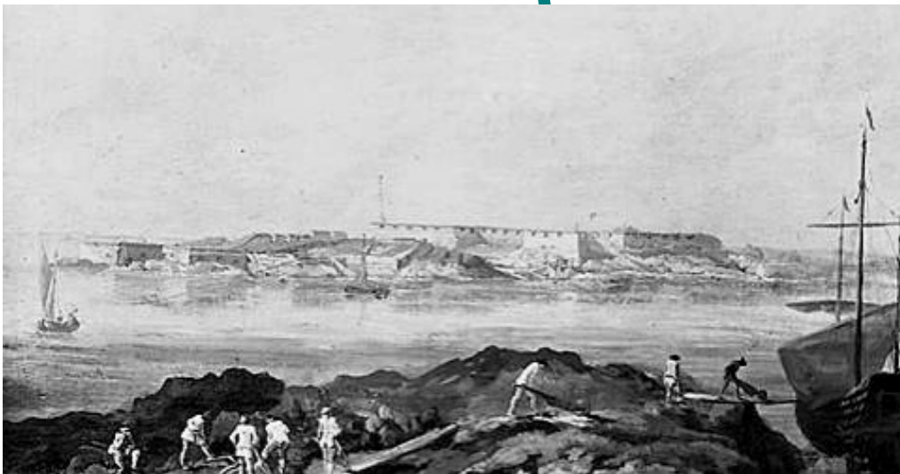
KUVA 32. Viapori

R uotsissa suurvalta-aseman menettämisestä syytettiin kuningasta ja hänen itsevaltaista asemaansa. Säädyt näkivät tilaisuutensa tulleen Kaarle XII:n kuoltua ja vähensivät kuninkaan valtaa kirjoittamalla uuden valtiomuodon. Uusi perustuslaki siirsi vallan säättää lakeja ja määrätä veroja kuninkaalta valtiopäiville, joiden tuli kokoontua vähintään joka kolmas vuosi. Kaikki neljä säätyä – aatelisto, papisto, porvaristo ja talonpojat – saivat lähettää edustajansa valtiopäiville. Koska uuden valtiomuodon ansiosta säädyt eivät enää olleet kuninkaasta riippuvaisia, kutsutaan ajanjaksoa 1718–1772 vapauden ajaksi tai säätyvallan ajaksi.