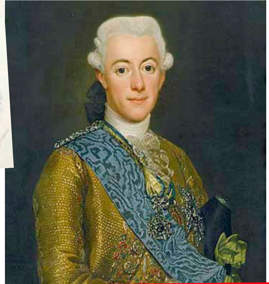
KUVA 34. Kustaa III – valistunut itsevaltiias

AATELISTEN SALALIITTO murhasi Kustaa III:n Tukholman oopperatalossa järjestetyissä naamiaisissa vuonna 1792.