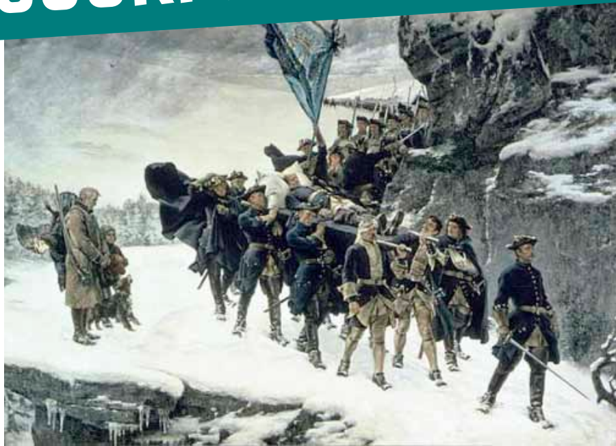
KUVA 29. Kaarle XII:n ruumissaatto. Maalaus maalattiin 160 vuotta tapahtuman jälkeen.

Suuren Pohjan sodan 1700–1721 myötä Ruotsin aika suurvaltana päättyi, ja valta-asetelma Itämeren alueella muuttui jälleen. Sota syttyi keväällä 1700, kun Venäjä, Puola ja Tanska yrittivät vallata takaisin Ruotsille menettämänsä alueet. Ruotsin kuninkaana toimi tuolloin vasta 17-vuotias Kaarle XII, jonka ajateltiin olevan heikko vastus. Ruotsalaiset kuitenkin hyökkäsivät Tanskan salmien yli Själlantiin ja pakottivat tanskalaiset rauhaan jo kesällä 1700. Kaarle XII jatkoi sotaretkensä Viron rannikolle Narvaan, missä hän voitti Venäjän tsaarin Pietari Suuren joukot yllätyshyökkäyksellä. Seuraavana vuonna Ruotsin armeija jatkoi matkaansa Puolaan, missä se kävi taisteluja seuraavat viisi vuotta.