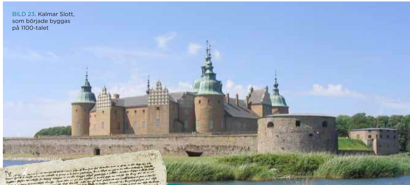
BILD 23. Kalmar Slott, som började byggas på 1100-talet

DEN EUROPEISKA FEODALISMEN slog dock aldrig igenom fullt ut i Norden. Bönderna i Norden underkastades aldrig livegenskap som på den övriga konti-