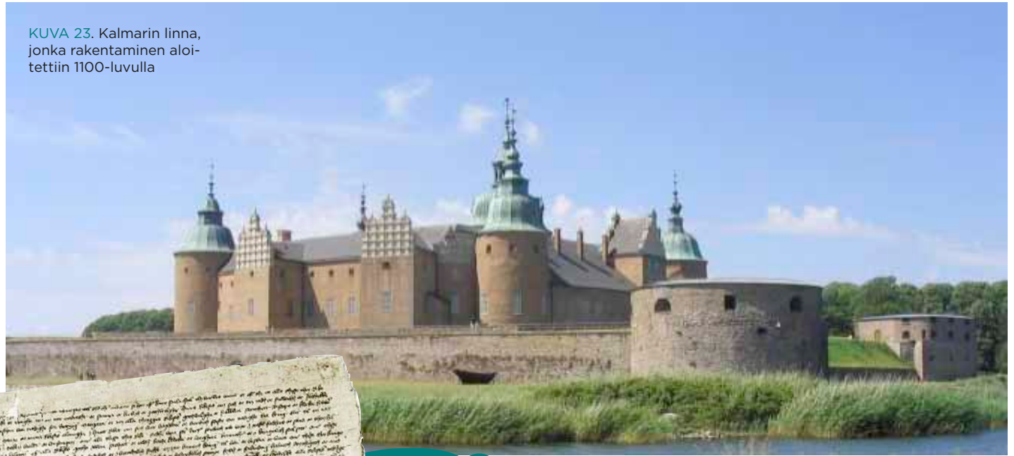
KUVA 23. Kalmarin linna, jonka rakentaminen aloitettiin 1100-luvulla

EUROOPASSA VALLALLA ollut feodalismi eli läänityslaitos ei kuitenkaan lyönyt koskaan täysin läpi Skandinaviassa. Esimerkiksi talonpojat säilyivät Pohjoismaissa vapaina eikä heitä koskaan alistettu maorjuuteen kuten muualla Manner-Euroopassa.