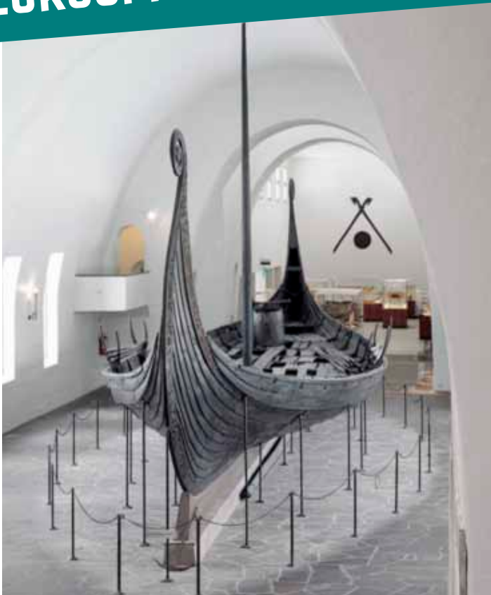
KUVA 7. Viikinkivene noin vuodelta 815–820 jKr. löydettiin Osebergistä Oslovuonon suulta Norjasta vuonna 1903