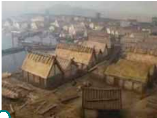
KUVA 10. Malli Birkan viikinkikaupungista, Ruotsin ensimmäinen kaupunki

ERITYISESTI ETELÄISESSÄ Skandinaviassa elettiin viikinkiaikana voimakasta taloudellisen ja kulttuurillisen kukoistuksen aikaa. Vanhat kauppapaikat kuten Hedeby Tanskan Jyllannissa ja Birka Ruotsissa Mälaren-järven rannalla kehittyivät hiljalleen suuriksi kaupungeiksi. Tuhannet viikinkiajalta säilyneet riimukivet kertovat paitsi viikinkien urotöistä ja sankariretkistä, myös kotiin jääneiden arkisesta elämästä sekä kristinuskon tulosta.