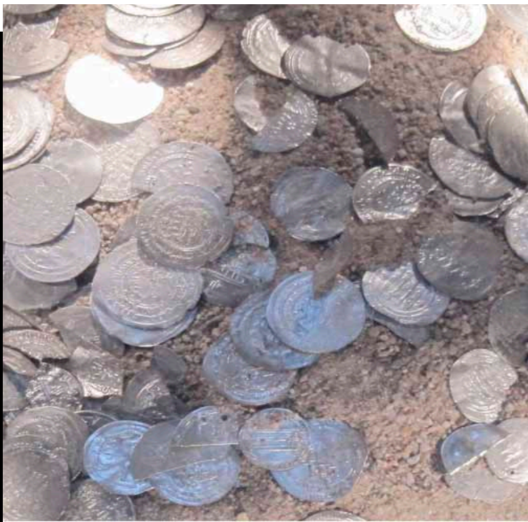
KUVA 8. Gotlannista löytyneitä arabialaisia hopeakolikoita 800-luvulta jKr.