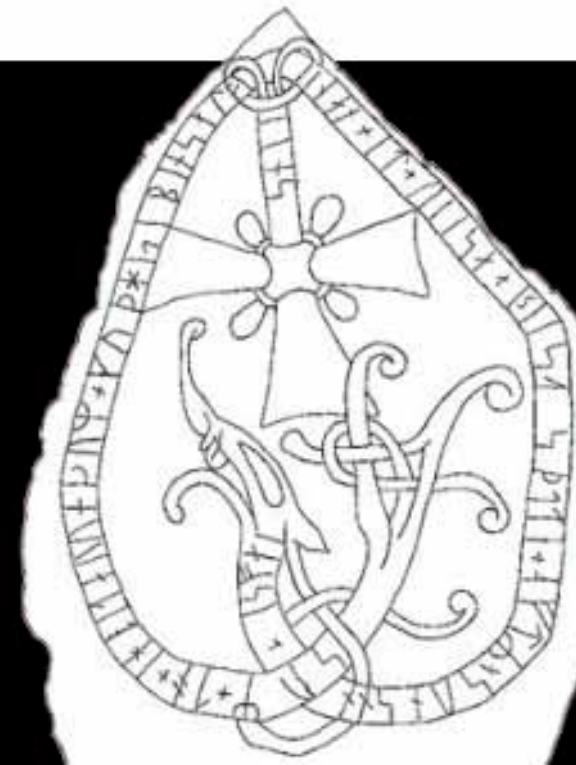
KUVA 9. Riimukivi 1000-luvulta Uplannin Torsätrasta. Kivessä lukee: "Unna pystytti tämän kiven pojalleen Östenille, joka kuoli kastepuvussa, Jumala hänen sieluaan auttakoon."