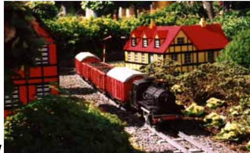
Legoland i Billund